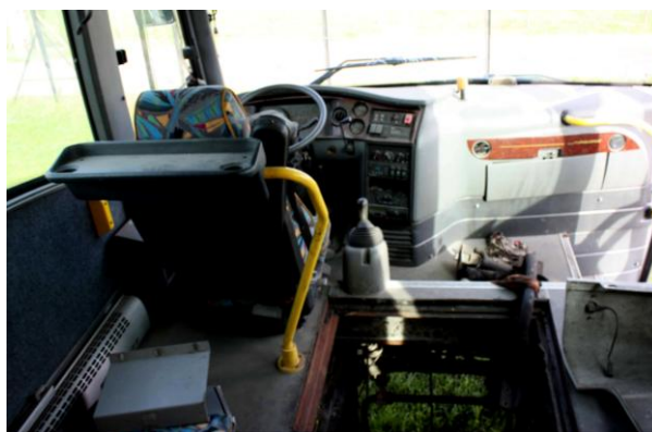
A busz motorjának helyén a zöld fű látszik !